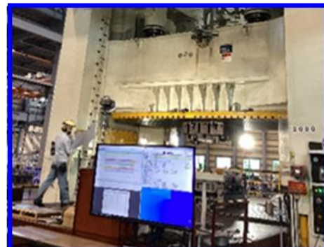
工場に設置された大型モニターで 日程や進捗状況を確認