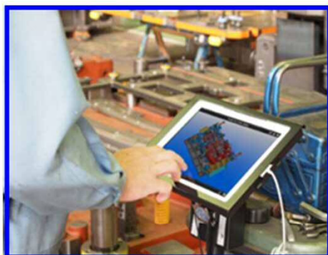
工場では1人1台の タブレットで金型を製作