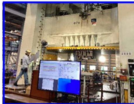
工場に設置された大型モニターで 日程や進捗状況を確認