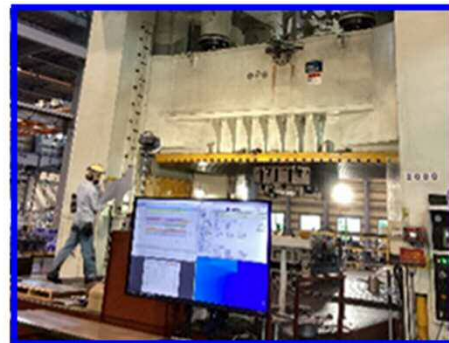
工場に設置された大型モニターで 日程や進捗状況を確認