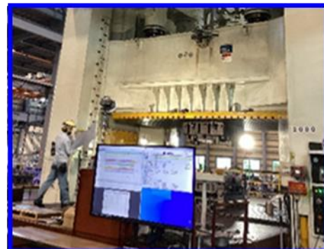
工場に設置された大型モニターで 日程や進捗状況を確認