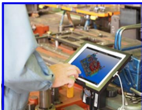
工場では1人1台の タブレットで金型を製作